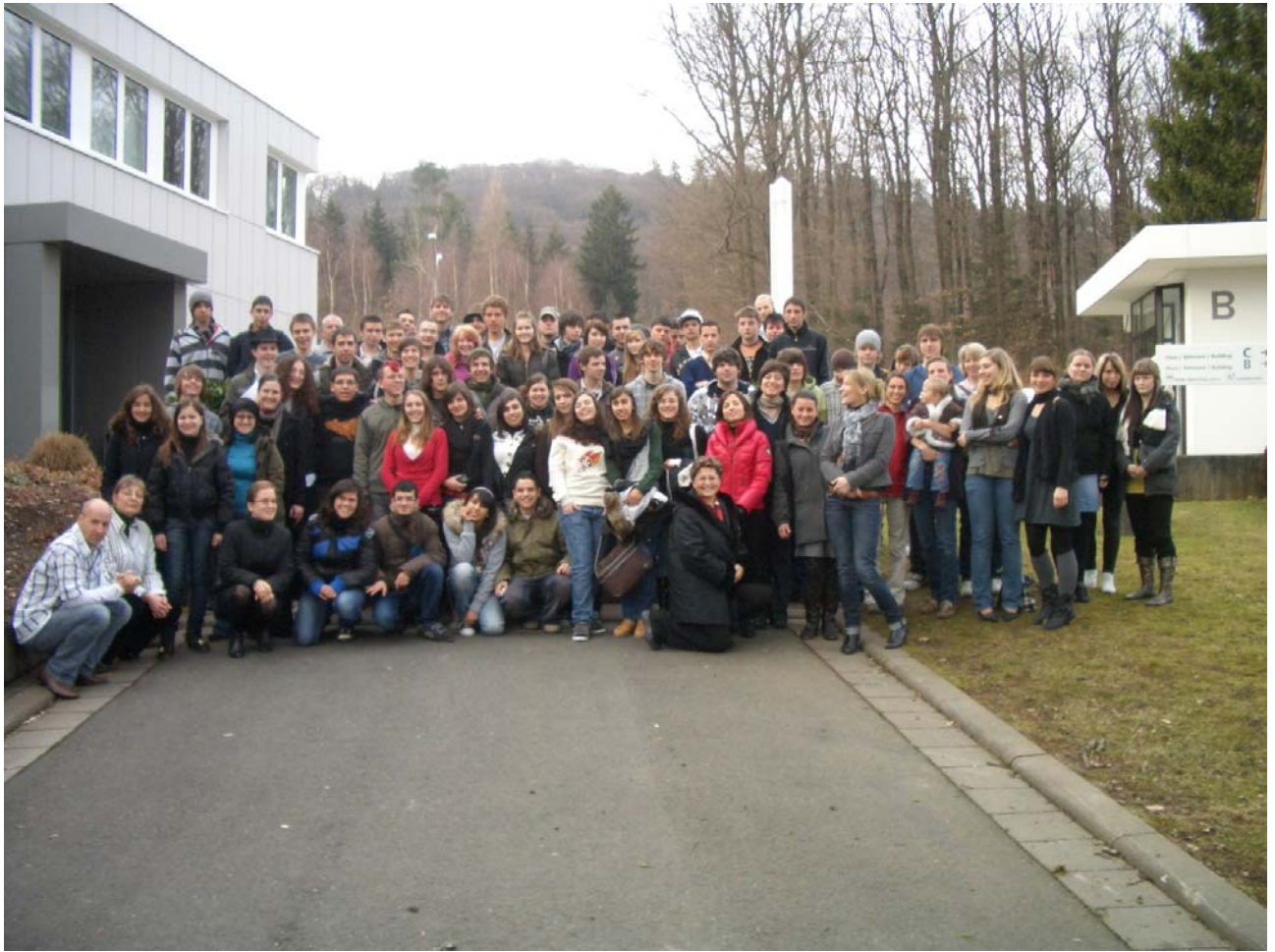
Osa kansainvälisestä ryhmästämme Akatemian edessä.