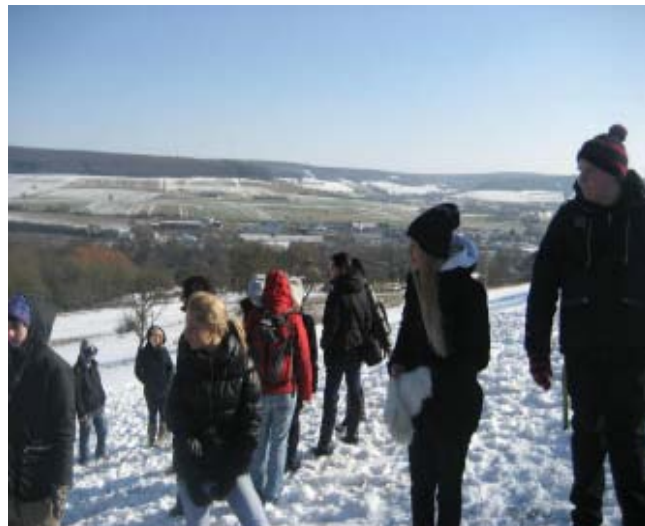
Kuva 6: Lepotauko ja maiseman ihailua Gersheimissa

Illalla koululla kestävän kehityksen projektit jatkuivat ja sen jälkeen koulun diskoon.