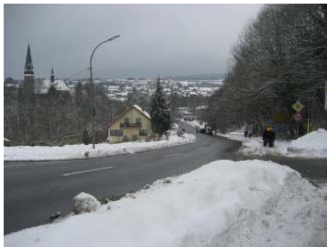
Kuva 1: Otzenhausenin maisemaa

Otzenhauseniin viimein saavuttuamme olivat kaikki innoissaan, huoneet näyttivät hyvältä ja ruokana oli ranskalaisia ja wienerleikettä! Yam yam.