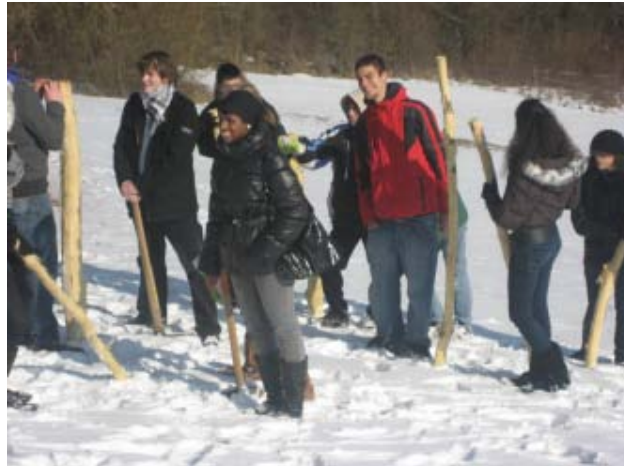
Kuva 5: Orkideanpelastajat rakentavat suoja-aitaa

Romanialaisilla pojilla oli oikea hengennostatusasenne, parruja kantaessaan he lauloivat romaniankielisiä kansanlauluja ja olivat muutenkin työnsankareita. Työn jälkeen söimme nuotiolla keittoa ja valokuvasimme jylyitä maisemia.