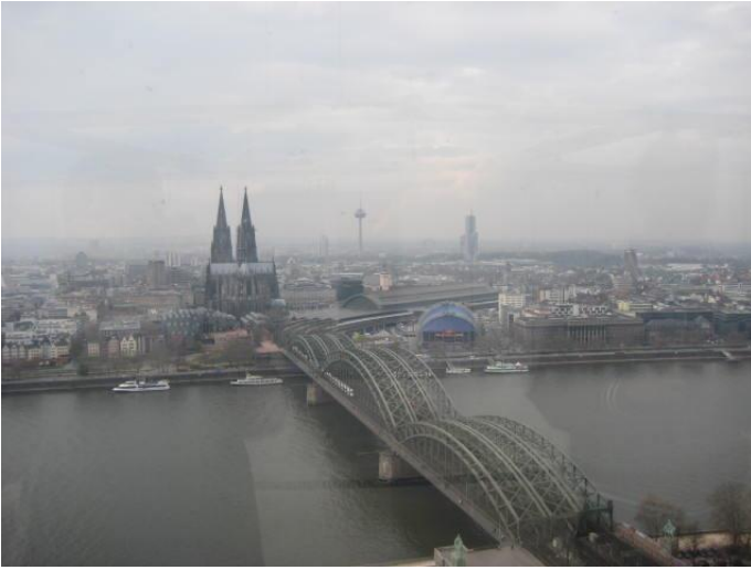
Näimme mm.Kölnin kuuluisan lukkosillan.