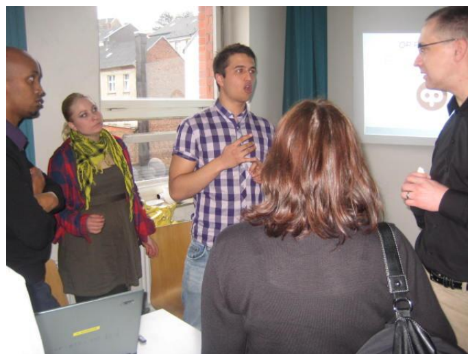
Osuuspankin ja sen toiminnan esittelyä.