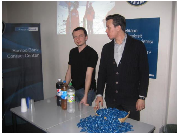
Sampopankin standilla sai karkkia.